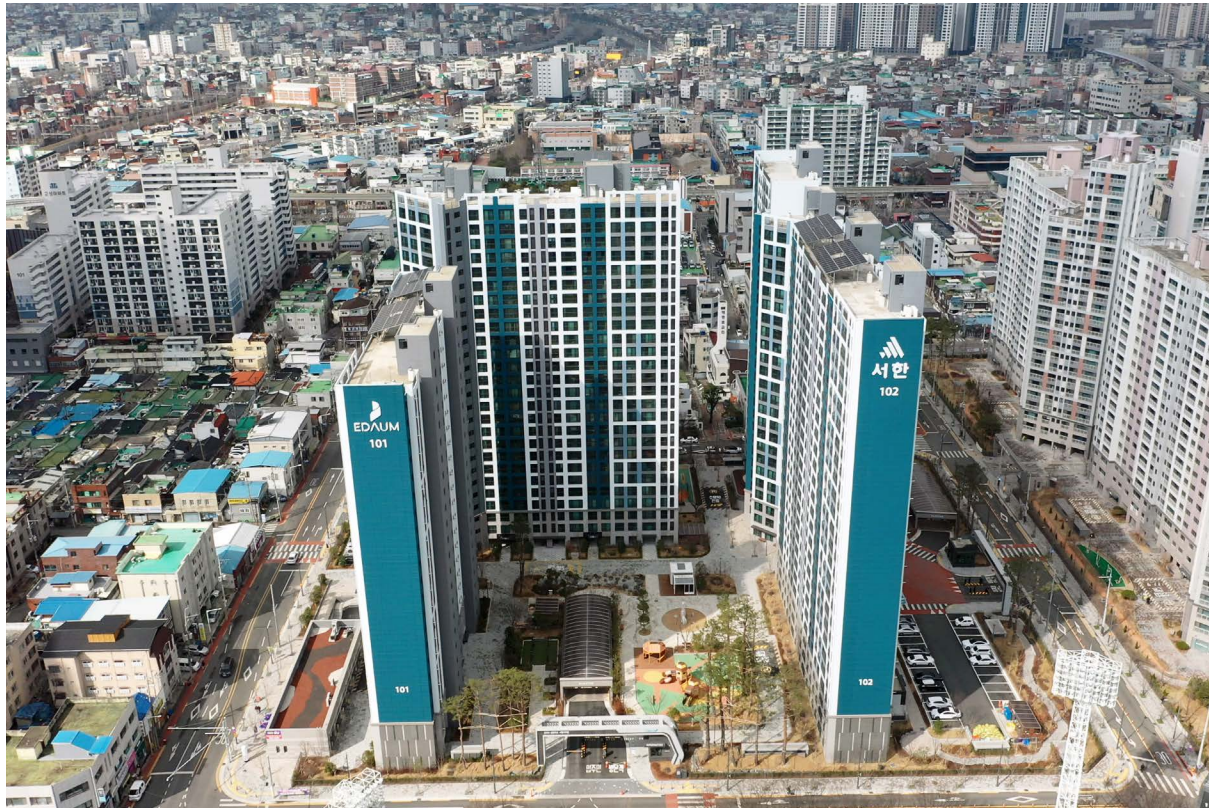
오페라센터파크 서한이다음 위치: 대구광역시 북구 고성동 / 규모: 총 417세대 / 공급: 전용 74㎡, 84㎡