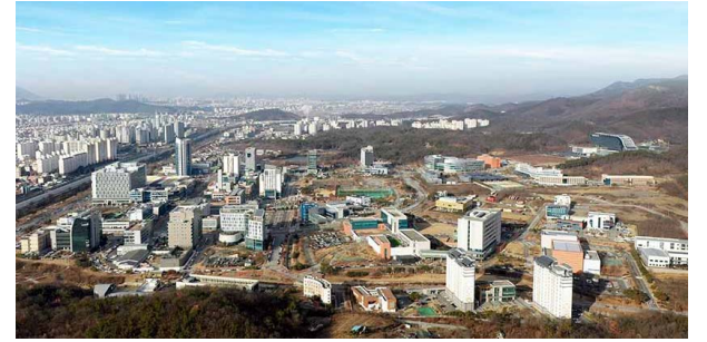
대구신서혁신도시 조성공사 위치: 대구광역시 동구 신서동 발주처: 한국토지주택공사 공사기간: 2008.12 ~ 2014.12