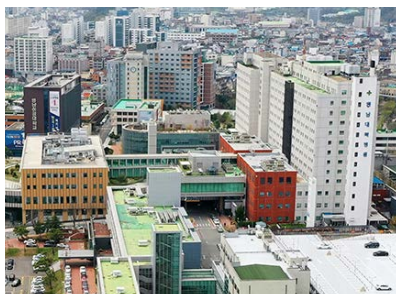
영남대학교병원 위치: 대구광역시 남구 대명동 발주처: 영남대학교 공사기간: 1988.02~1991.07