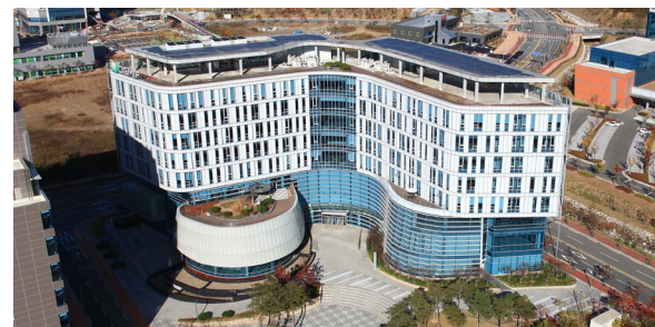
혁신도시 커뮤니케이션센터 위치: 대구광역시 동구 동내동 발주처: 대구광역시 건설본부 공사기간: 2011.10~2013.05