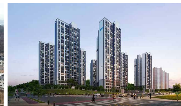
하늘도시 서한이다음 위치: 인천경제자유구역 영종지구 영종국제도시 규모: 총 930세대 공급: 전용 64㎡, 74㎡, 84㎡