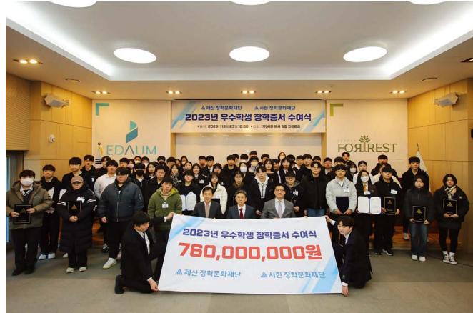
장학재단 장학금 지급 및 기타지원사업 (2006년~) (주)서한은 대구·경북 내 장학재단을 설립하여 대구교육청과 경북교육청을 통해 학업능력이 우수하고 재능이 뛰어난 학생 총 4,590명에게 56억여 원의 장학금을 전달하며 우수인재 발굴 및 육성에 힘쓰고 있습니다.