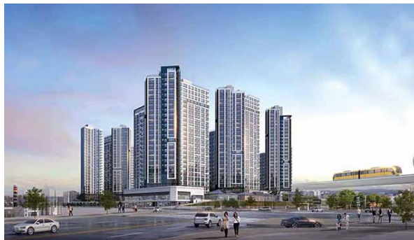
대봉 서한이다음 위치: 대구광역시 중구 대봉동 규모: 총 541세대 공급: 전용 67㎡, 84㎡, 99㎡