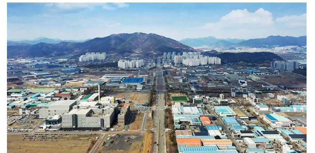
대구국가산업단지 조성공사 위치: 대구광역시 달성군 구지면 발주처: 한국토지주택공사 공사기간: 2009.05~2013.06