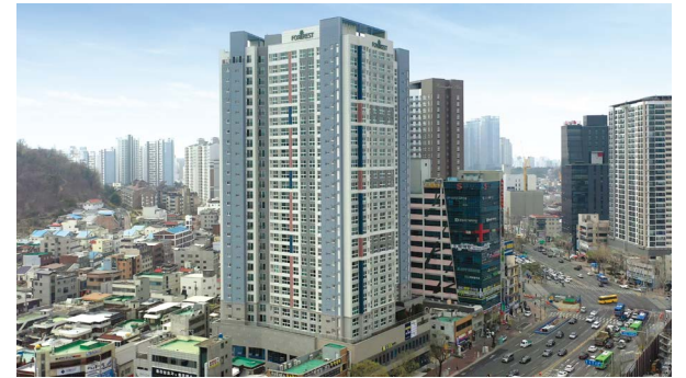
만촌역 서한포레스트 위치: 대구광역시 수성구 만촌동 규모: 총 258세대(아파트 102세대, 오피스텔 156실) 공급: 아파트 전용 84㎡, 162㎡, 168㎡ / 오피스텔 전용 29㎡, 50㎡