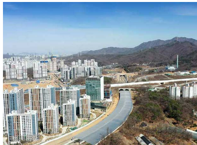
과천시 국도47호선 우회도로 건설공사 위치: 경기도 과천시 갈현동 발주처: 한국토지주택공사 공사기간: 2016.11 ~ 2020.12