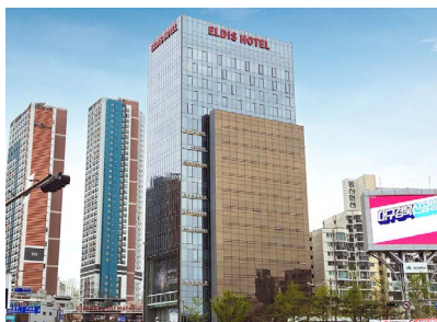
대구 메디컬센터 증축공사 위치: 대구광역시 중구 달구벌대로 2033(동산동) 발주처: ㈜엘디스 리젠트호텔 공사기간: 2012.01~2014.06