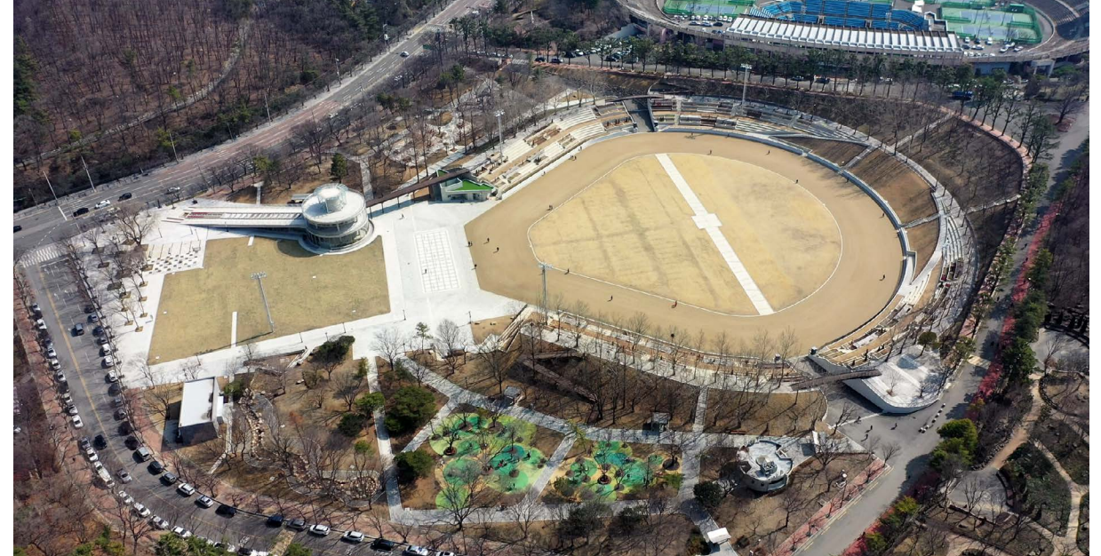
두류공원 시민광장 위치: 대구광역시 달서구 두류동 일원 / 발주처: 대구광역시 도시건설본부 / 공사기간: 2022.02.21 ~ 2023.08.14

두류공원 시민광장 / 대구콘서트하우스 / 대구육상진흥센터 / 대구텍스타일컴플렉스 등