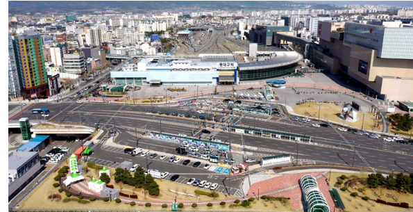
동대구역 고가교 개체공사 위치: 대구광역시 동구 장동로 20(신천동) 발주처: 대구광역시 건설본부 공사기간: 2011.08~2017.10