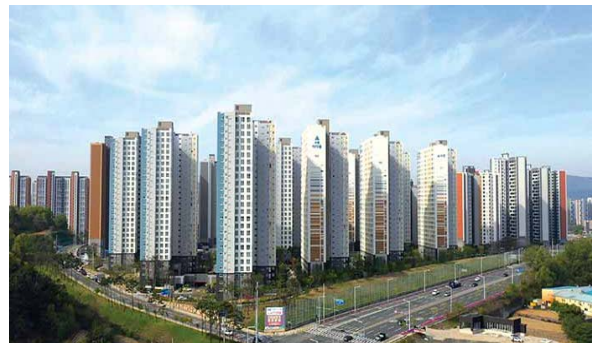
대구국가산단 서한이다음 위치: 대구광역시 달성군 구지면 대구국가산업단지 A2-2블록 규모: 총 1038세대 공급: 전용 66㎡, 74㎡, 84㎡