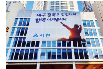
기타 사회공헌활동 (코로나 관련 공헌활동) 코로나19 사태 확산에 따라 어려움을 겪고 있는 대구광역시에 실질적인 도움이 될 수 있도록 성금 및 기탁물품 10억원을 기부하는 등 기업의 사회적 책임을 다하고 있습니다.