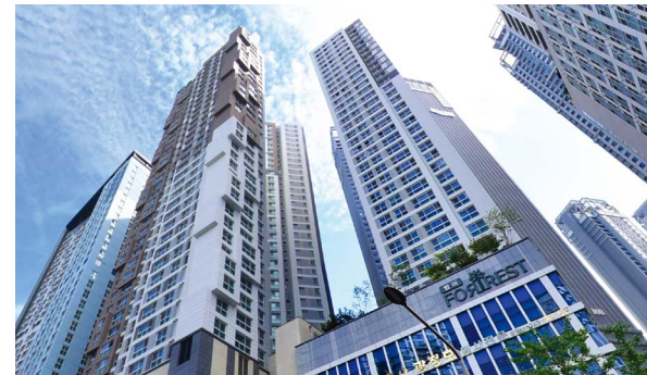
범어 서한포레스트 위치: 대구광역시 수성구 범어동 규모: 총 310세대(아파트 202세대, 오피스텔 108실) 공급: 아파트 전용 84㎡, 98㎡ / 오피스텔 전용 59㎡, 74㎡, 84㎡