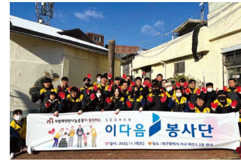
이다음봉사단 봉사활동 (2014년~) 서한 이다음봉사단은 출범 이후 총 24회에 걸쳐 사랑의 밥차, 김장봉사, 뽕나눔 봉사, 연탄나눔 봉사, 수해복구 봉사, 환경미화 봉사 등 실질적 도움이 될 수 있는 여러 봉사활동을 꾸준히 펼치며 보다 많은 이웃들에게 실질적인 도움을 주기 위해 다양한 노력을 기울이고 있습니다.