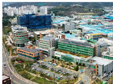
대구의료원 공립 치매 요양 병원 건립공사 위치: 대구광역시 서구 중리동 발주처: 대구의료원 공사기간: 2006.03~2007.06