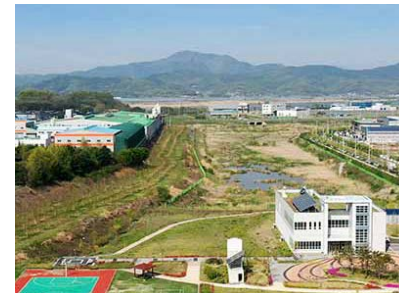
국가산단 폐수처리장 위치: 대구시 달성군 구지면 일원 발주처: 한국토지주택공사 공사기간: 2014.11 ~ 2017.5