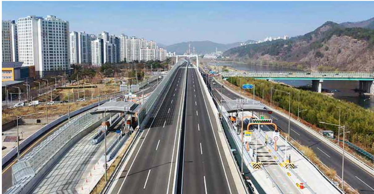
고속국도 제700호선 위치: 대구광역시 달서구~달성군 / 발주처: 한국도로공사 / 공사기간: 2014.05~2020.02

도시철도3호선 매천역 / 수도권광역급행철도 B노선(용산~상봉) / 도시철도2호선 5·10·13공구 과천 국도47호선 우회도로 / 고속국도 700호선 / 국가산업단지 진입도로 / 고속국도 14호선 등