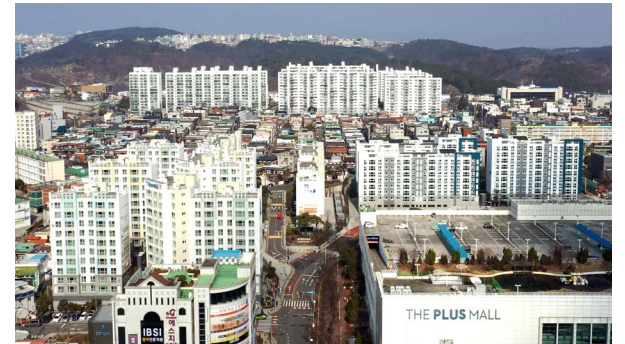
울산변영로 서한이다음 1,2,3단지 위치: 울산광역시 중구 복산동 규모: 총 361세대 (1단지 208세대 / 2단지 44세대 / 3단지 109세대) 공급: (1단지) 전용 72㎡, 84㎡, (2단지) 전용 84㎡, (3단지) 전용 82㎡, 84㎡