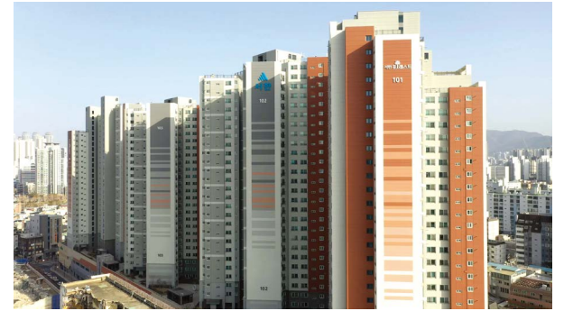
대봉 서한포레스트 위치: 대구광역시 중구 대봉동 규모: 총 679세대(아파트 469세대, 오피스텔 210실) 공급: 아파트 전용 62㎡, 74㎡, 79㎡, 84㎡, 99㎡ / 오피스텔 전용 59㎡, 74㎡, 84㎡