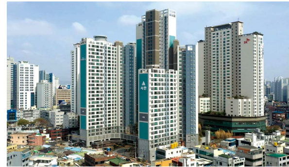
반월당역 서한포레스트 위치: 대구광역시 중구 남산동 규모: 총 427세대(아파트 375세대, 오피스텔 52실) 공급: 아파트 전용 69㎡, 78㎡, 84㎡ / 오피스텔 전용 67㎡