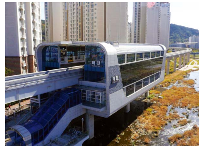
도시철도3호선 매천역 위치: 대구광역시 북구 매천동 발주처: 대구광역시 도시철도건설본부 공사기간: 2009.06~2014.12