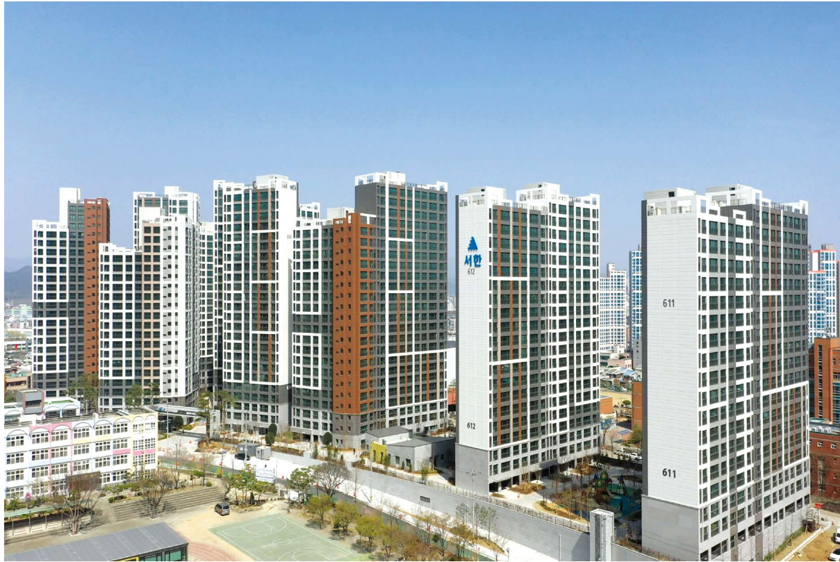
서대구역 서한이다움 더 퍼스트 위치:대구광역시 서구 평리동 / 규모: 총 856세대 / 공급: 전용 62㎡, 76㎡, 84㎡, 99㎡