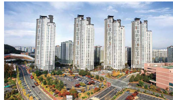
펜타힐즈 서한이다음 위치: 경북 경산시 중산동 규모: 총 784세대 공급: 전용 59㎡, 72㎡, 84㎡, 108㎡, 118㎡