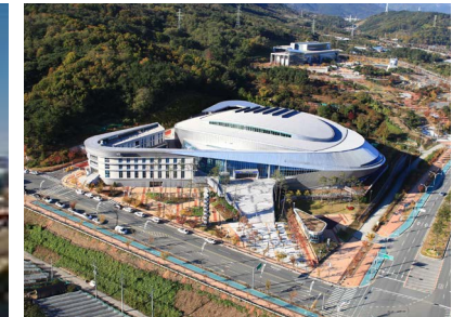
대구육상진흥센터 위치: 대구 수성구 삼덕동 발주처: 대구광역시 공사기간: 2010.03~2012.03