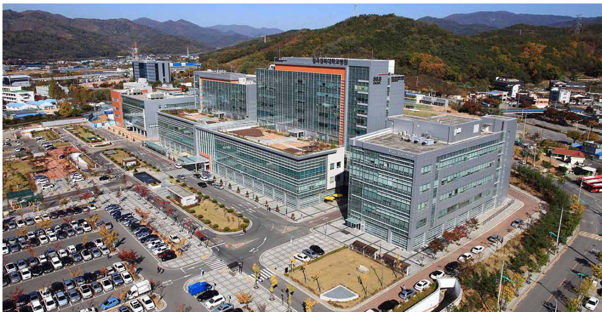
칠곡경북대병원, 암센터 및 노인의료시설 위치: 대구광역시 북구 학정동 474 / 발주처: 경북대학교 / 공사기간: 2007.03~2010.07

칠곡경북대학교병원암센터 / 대구메디센터 / 영남대학교병원 / 대구의료원치매병원 등