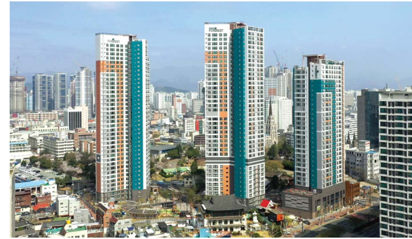
청라언덕역 서한포레스트 위치: 대구광역시 중구 동산동 규모: 총 329세대(아파트 302세대, 오피스텔 27실) 공급: 아파트 전용 84㎡A, 99㎡ / 오피스텔 전용 84㎡ 150㎡, 182㎡