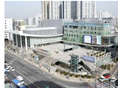
대구시민회관 리노베이션 개발사업 (대구콘서트하우스) 위치: 대구광역시 중구 태평동 발주처: 한국자산관리공사 공사기간: 2011.03~2013.08