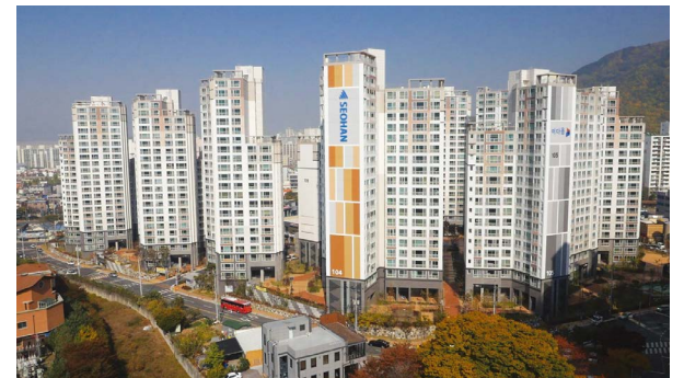
서한이다음 레이크뷰 위치: 대구광역시 달서구 도원동 규모: 총 633세대 공급: 전용 59㎡, 84㎡, 97㎡