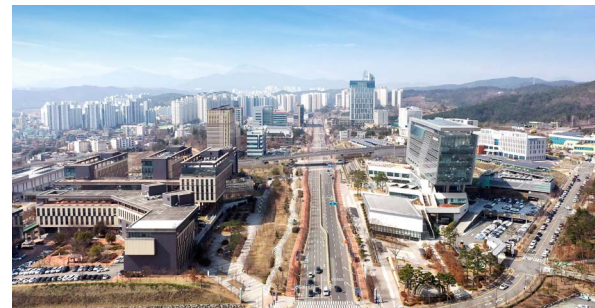
울산우정혁신포지 조성공사 위치: 울산 중구 장현동 발주처: 한국토지주택공사 공사기간: 2009.03~2015.05