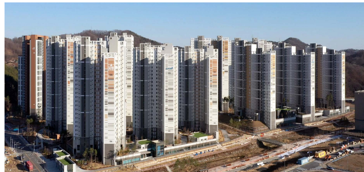
유성 둔곡지구 서한이다음 위치: 대전광역시 유성구 둔곡동 / 규모: 1단지 총 816세대, 2단지 총 685세대 / 공급: (1단지) 전용 59㎡A·B / (2단지) 전용 78㎡, 84㎡