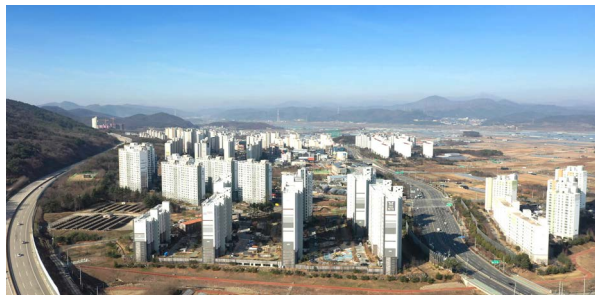
옥포지구 조성공사 위치: 대구 달성군 옥포면 강림리, 교항리 일원 발주처: 한국토지주택공사 공사기간: 2008.03 ~ 2015.08