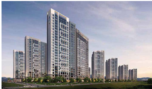
오송역 서한이다움 노블리스 위치: 충청북도 청주시 흥덕구 오송읍 규모: 총 1,113세대 공급: 전용 101㎡, 119㎡, 134㎡, 150㎡, 182㎡