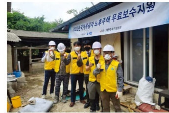
집수리 복지사업 (2006년~) 지난 2006년부터 19년간 국가유공자 노후주택 보수지원사업에 참여하여 총 27주택에 2억원을 지원함으로써 나라를 위해 헌신한 분들의 주거여건을 개선하고 있으며 또한 주거환경이 열악한 저소득계층의 노후주택을 수리하는 '사랑의 집수리' 활동도 꾸준히 진행하고 있습니다.