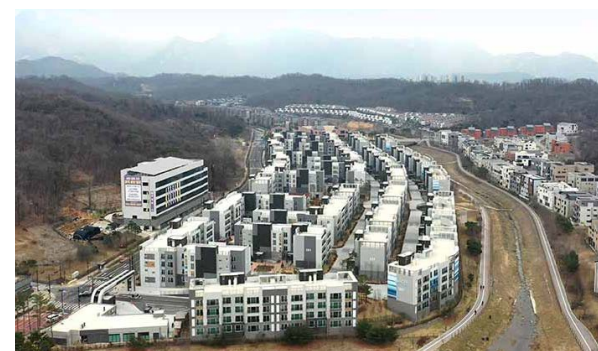
고양 삼송 비아티움 위치: 경기도 고양시 덕양구 삼송지구 B-2블록 규모: 총 528세대 공급: 전용 84㎡