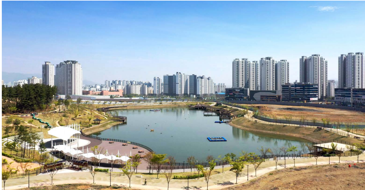
경산 펜타힐즈 조성공사 위치: 경상북도 경산시 중산동 / 발주처: 대한토지신탁(주) / 공사기간: 2018.05~2020.07

동대구역 고가교 개체공사 / 동고령일반산업단지 / 대전둔곡지구 / 부산 명지지구 / 경산 중산 펜타힐즈 조성공사 / 대구테크노폴리스 / 대구혁신포지 / 울산우정혁신포지 / 대구국가산단 등