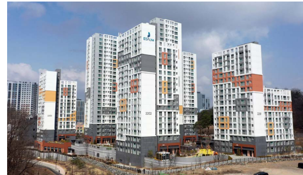
시흥장현 A12블록 서한이다음 프레미얼 위치: 경기도 시흥시 장현동 규모: 총 413세대 (공공분양 276세대 / 행복주택 136세대) 공급: 전용 55㎡ABC