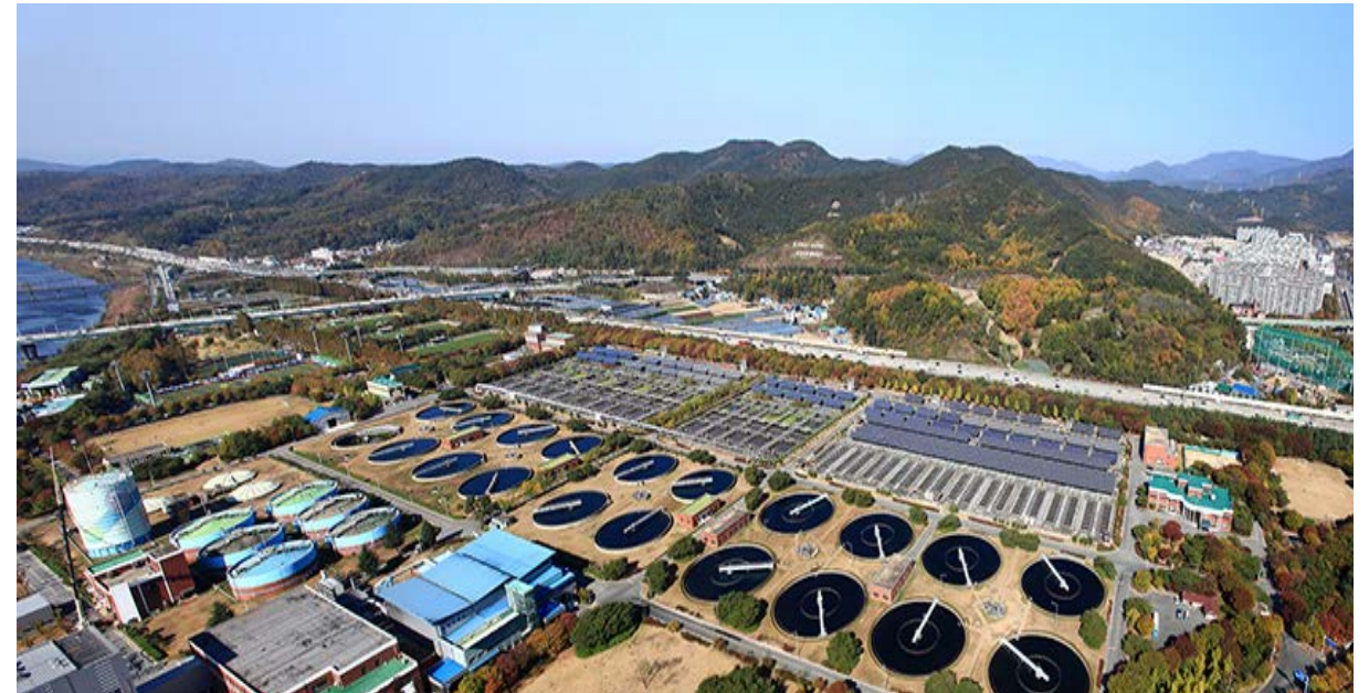
신천하수처리장 위치: 대구광역시 북구 서변동 / 발주처: 대구광역시 건설본부 / 공사기간: 2011.02~2012.08

성서자원회수시설 개체사업 / 국가산단 오수·폐수처리장 / 신천하수처리장 / 테크노폴리스 폐수종말처리장 / 대명하수처리형시설 / 등