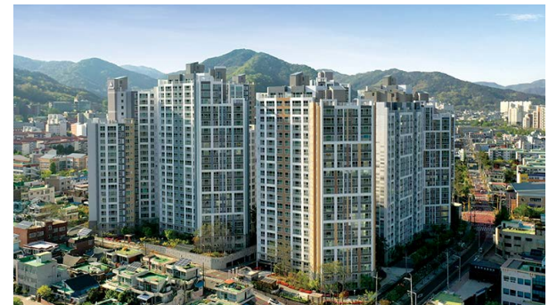
신매곡 서한이다음 위치: 전남 순천시 매곡동 규모: 총 725세대 공급: 59㎡, 69㎡, 85㎡, 107㎡