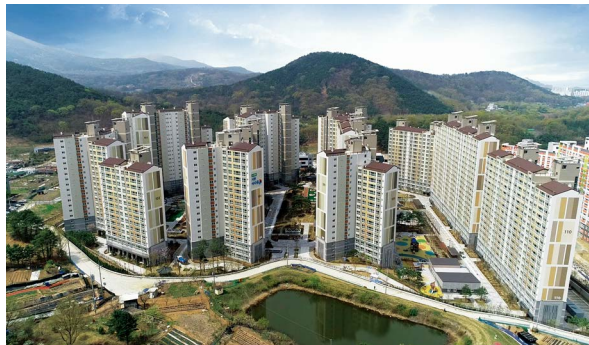
수목원 서한이다움 위치: 대구광역시 달서구 대곡동 규모: 총 849세대 공급: 전용 74㎡, 84㎡, 99㎡, 101㎡