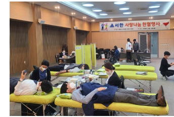
사랑나눔 헌혈행사 (2020~) 지난 2020년부터 대한적십자사 및 대구 경북혈액원과 함께 동결기 지역 혈액수급 위기상황 극복과 자발적 헌혈문화 조성을 위해 서한 임직원들의 자발적인 참여로 '사랑의 릴레이 헌혈' 행사를 실시하고 있습니다.