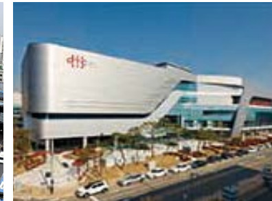
대구텍스타일컴플렉스 건립공사 위치: 대구시 동구 봉무동 1560-1, 1560-2 발주처: 대구시 건설관리본부 공사기간: 2011.12~2014.06