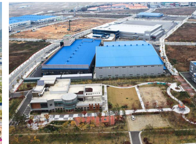
테크노폴리스 폐수종말처리장 위치: 대구 달성군 유가면 일원 발주처: 대구시 건설본부 공사기간: 2012.03~2014.03