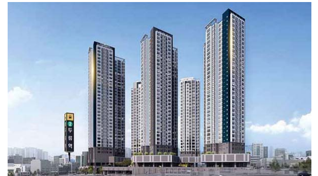
두류역 서한포레스트 위치: 대구광역시 달서구 두류동 규모: 총 576세대(아파트 480세대, 오피스텔 96실) 공급: 아파트 전용 59㎡, 84㎡ / 오피스텔 전용 29㎡, 84㎡