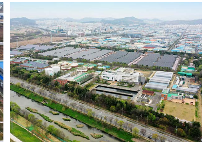
대명하수처리형 시설 위치: 대구시 달서구 대천동 770, 서부하수처리장 발주처: 한국수자원공사 공사기간: 2006.12~2009.02