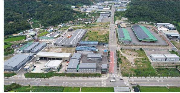
동고령 일반 산업단지 위치: 경북 고령군 성안면 박곡.무계리 일원 발주처: (주)양원기업 공사기간: 2015.12~2018.12