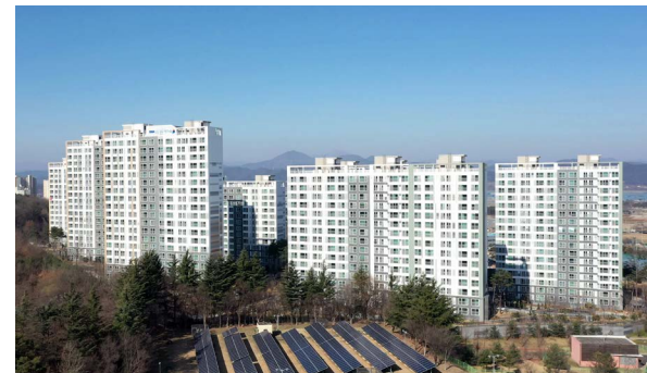
옥포지구 서한이다음 위치: 대구광역시 달성군 옥포택지개발지구 A-3블록 규모: 총 688세대 공급: 전용 59㎡