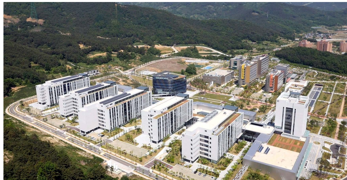
대구경북과학기술원 기숙사 임대형 민자사업 위치: 대구광역시 달성군 현풍면 테크중앙대로 333 / 발주처: ㈜희망세움이차 / 공사기간: 2016.01~2017.06

대구대 공학관 / 영남이공대 건설관 / 금오공과대학 제1대학 / 경남대학교 산학협력관 / 대구경북과학기술연구원 / 대구혁신도시 커뮤니케이션센터 / 서대구 복합지식산업센터 등