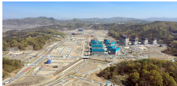
국제과학비즈니스벨트 거점지구 둔곡 조성공사 위치: 대전시 유성구 구룡동 321 발주처: 한국토지주택공사 공사기간: 2016.08~2019.08