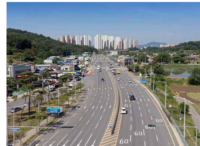
국가산업단지 진입도로 위치: 대구광역시 달성군 현풍면~구지면 발주처: 부산지방국토관리청 공사기간: 2014.12~2019.01