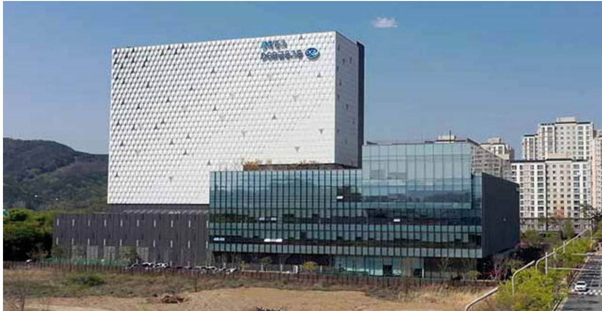
대구은행 DGB혁신센터 위치: 대구광역시 동구 봉무동 1546-1번지 / 발주처: (주)대구은행 / 공사기간: 2017.04 ~ 2018.07

대구은행 혁신도시 / 현대시티아울렛 / 제주리조트마린호텔 / 교보생명빌딩(수성점, 신암점) 등