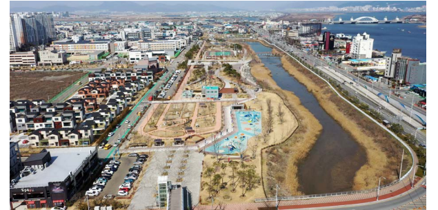
부산 명지지구 조경공사 위치: 부산광역시 강서구 공항로 15번길 28 발주처: 한국토지주택공사 공사기간: 2014.08~2019.11